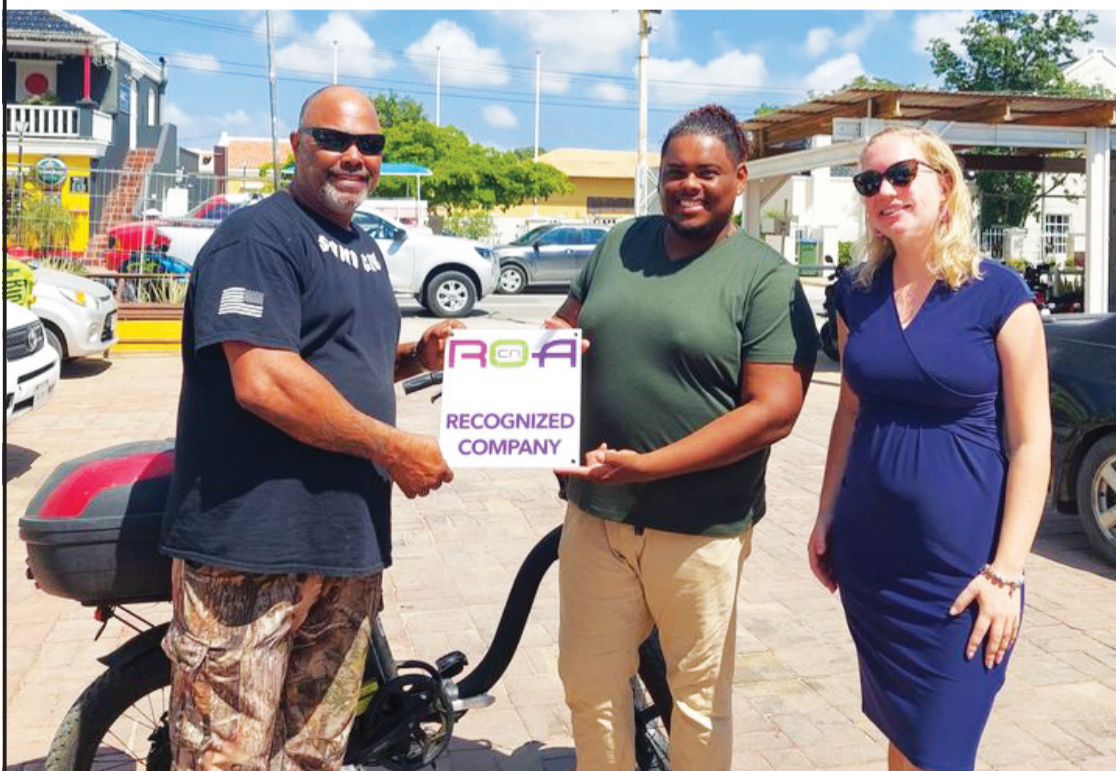
Rento Fun Drive N.V. ta un kompania konosí na Boneiru ku awor ta ofishalmente rekonosé pa ROA CN pa duna guia na studiantenan di MBO. Nan por guia studiantenan di turismo i negoshi. Sigui ku e bon trabou.